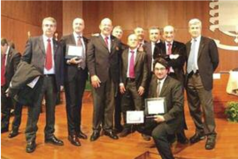
Il governatore Maurizio Triscari con i presidenti dei club siciliani

A Roma Forum nazionale su etica sociale e culturale: numerosi i ragazzi e i Club di tutta Italia che hanno partecipato. Molti i siciliani che hanno ricevuto importanti riconoscimenti. Una giovane di Lampedusa commuove con il suo tema e vince il primo premio per la composizione