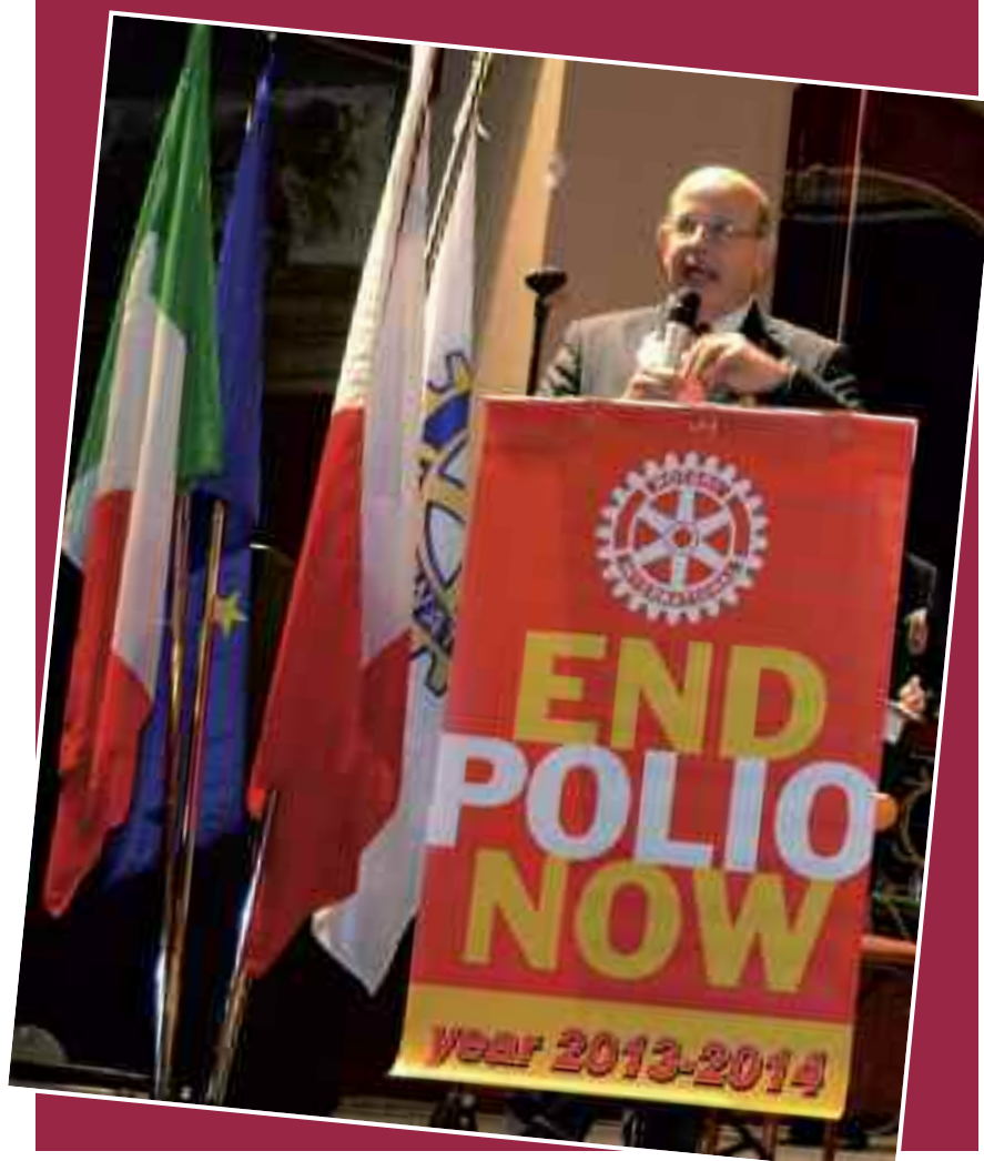
Le foto dell'evento al Teatro Politeama