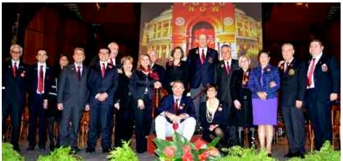
Nella foto in alto la consegna dei premi ai Club. In basso il Governatore Triscari con lo staff distrettuale e altri rotariani che hanno collaborato all'organizzazione del concerto