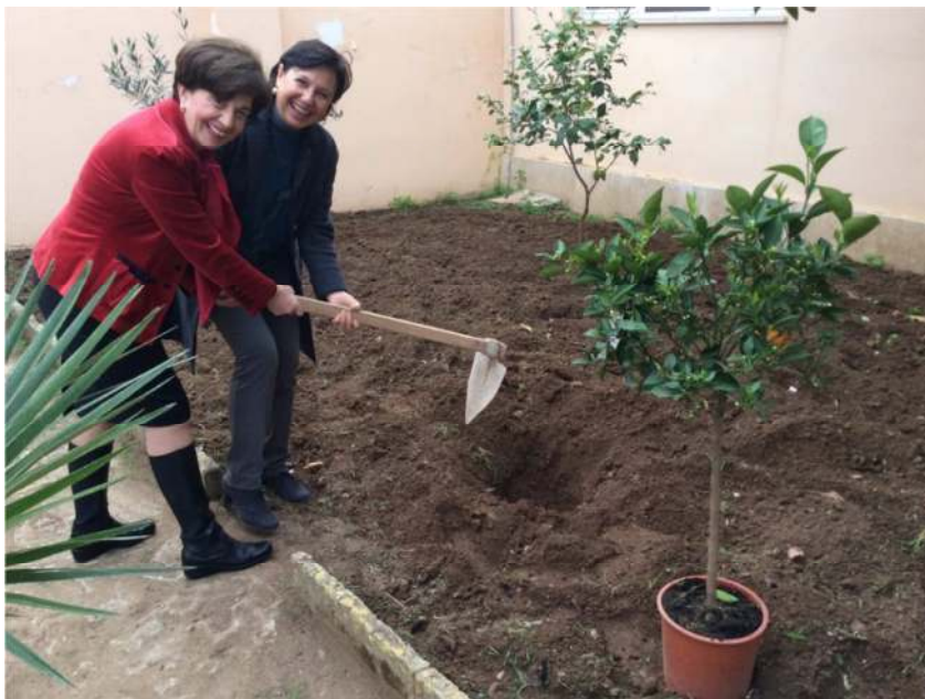
La Presidente Vita ed Adele preparano l'aiuola della scuola media Eugenio Pacelli di Paceco prima della piantumazione degli alberelli di arancio