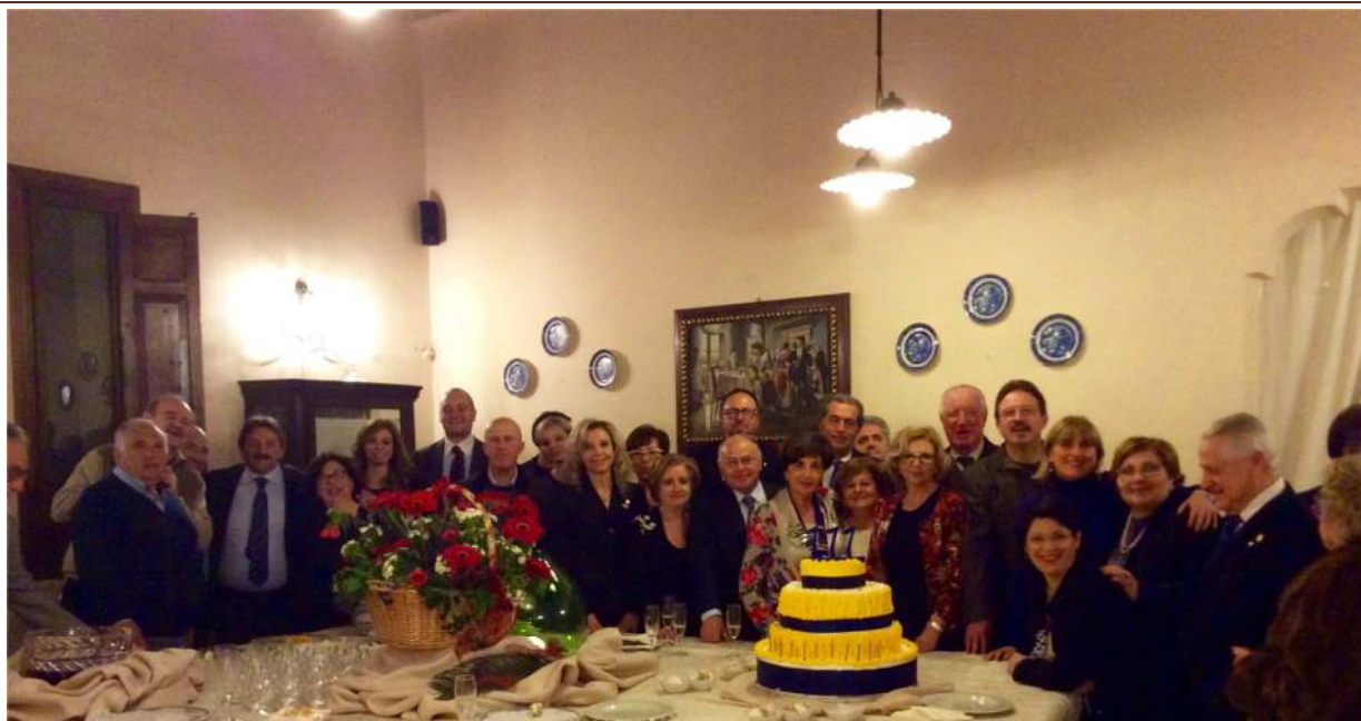
Foto di gruppo dei soci del R. C. Trapani Birgi Mozia con la torta dell'anniversario del Rotary