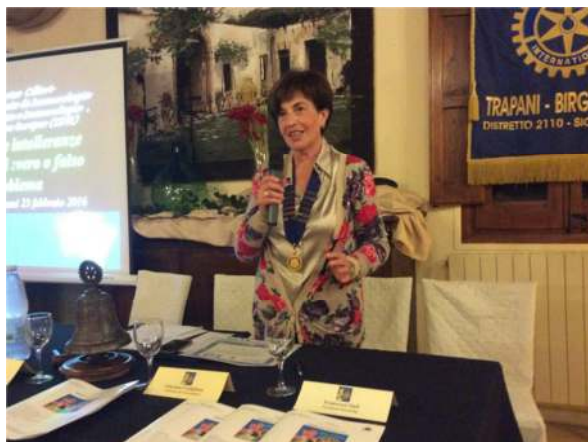
La presidente introduce l'argomento