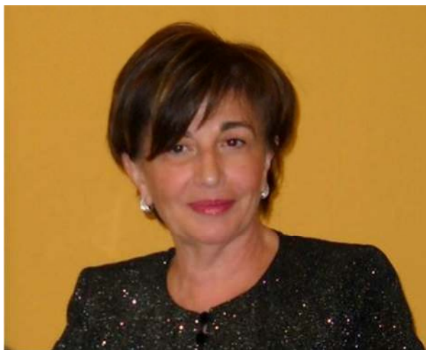
Presidente Vita Maltese