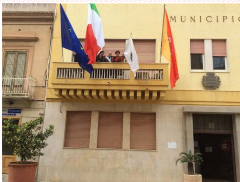
La bandiera del Rotary esposta al balcone dal Palazzo Municipale di Paceco