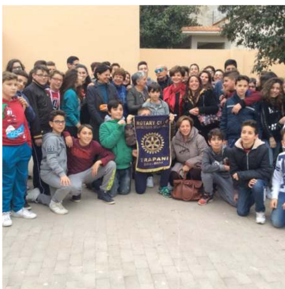
Gli studenti della scuola media Eugenio Pacelli di Paceco

La presidente, rivolgendosi agli studenti, ha ricordato la mission del Rotary nel mondo, la figura del fondatore del club Paul Harris, che donava una pianta in ogni città che visitava, il ruolo del club, che attraverso il programma polio plus con l'aiuto della fondazione di Bill Gates ha promosso la diffusione del vaccino in quei paesi in cui la situazione politica e sanitaria non lo aveva favorito. L'attenzione che il Rotary rivolge ai giovani di tutto il mondo attraverso l'istituzione di Borse di studio, scambio giovani, corsi di comunicazione e leadership l'istituzione di club di giovanissimi come l'Interact ed il Rotaract.