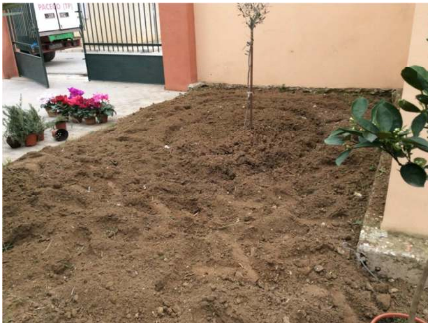
L'aiuola prima della piantumazione